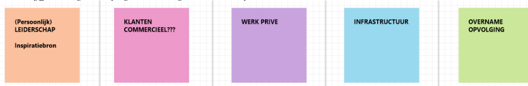
Afbeelding 2, Thema's -hoog over-

De bij elkaar passende onderwerpen hebben we, nadat ze een kleur kregen, een passende titel gegeven, dat zijn de thema's. Als eerste voorbeeld noem ik “Infrastructuur”. Daar staan bereikbaarheid, problemen in contact met de overheid en ontwikkelingen in de energietransitie centraal. Het thema “Klanten Commercieel” gaat over de verscheidenheid in commercieel/klantgericht werken, online aanwezigheid/vindbaarheid, maar ook de vraag; Hoe krijg ik de juiste prijs voor mijn dienst of product?